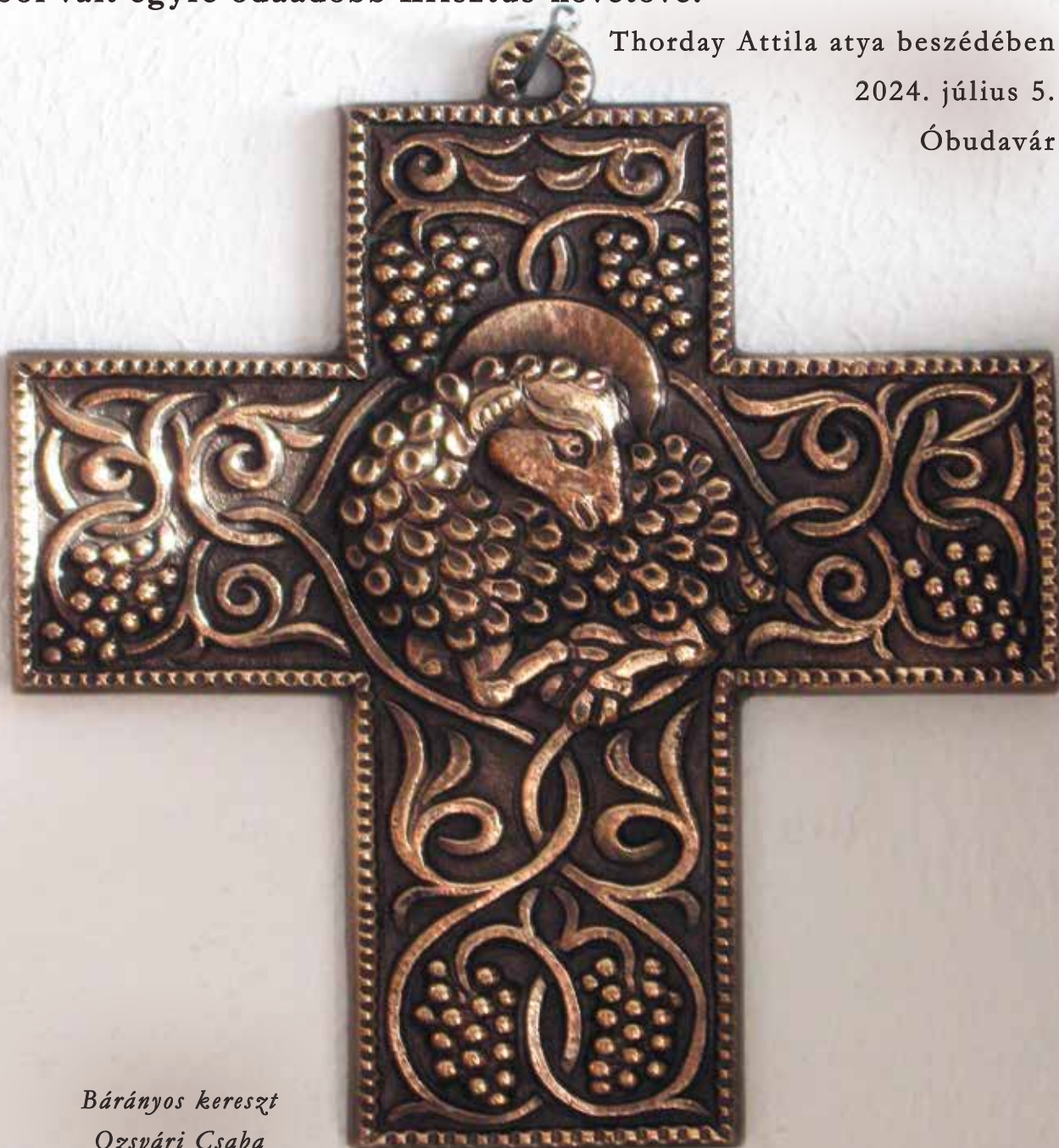
Báránys kereszt Ozsvári Csaba